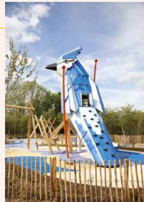
L'Oiseau bleu dans le Parc des Groupes.