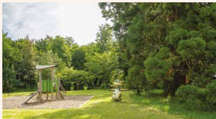
Le parc Manouchian.

Les projets feront l'objet de concertations avec les riveraines et les riverains qui sont directement concernés.