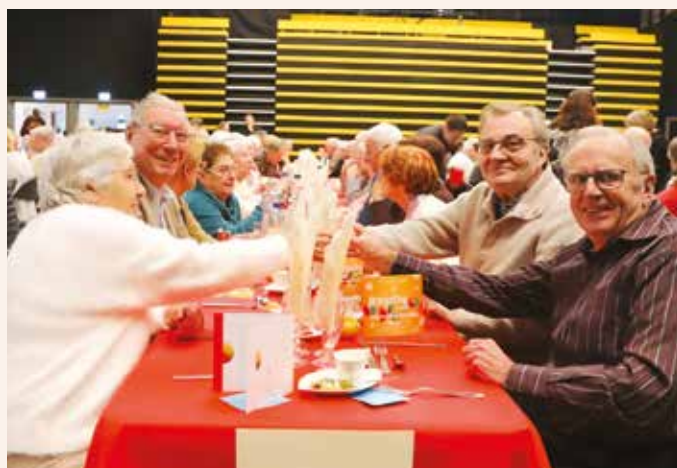
Le repas des seniors.