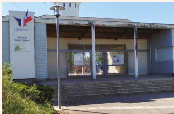
Rénovation thermique de l'école élémentaire Paul BERT.