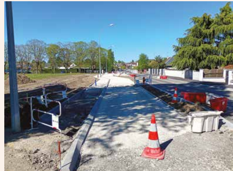
Avancée des travaux rue Croix Baudu, avril 2026.