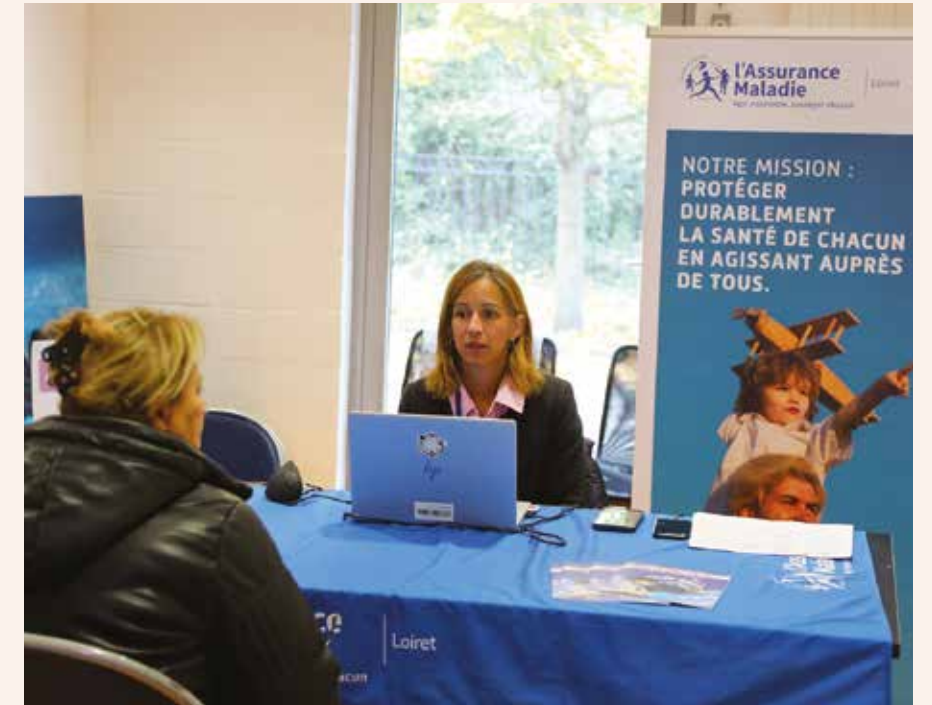
Les Journées prévention santé, en octobre 2025, au sein des Maisons pour tous.