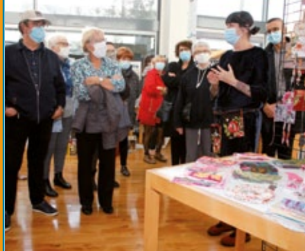
vu à Saint Jean