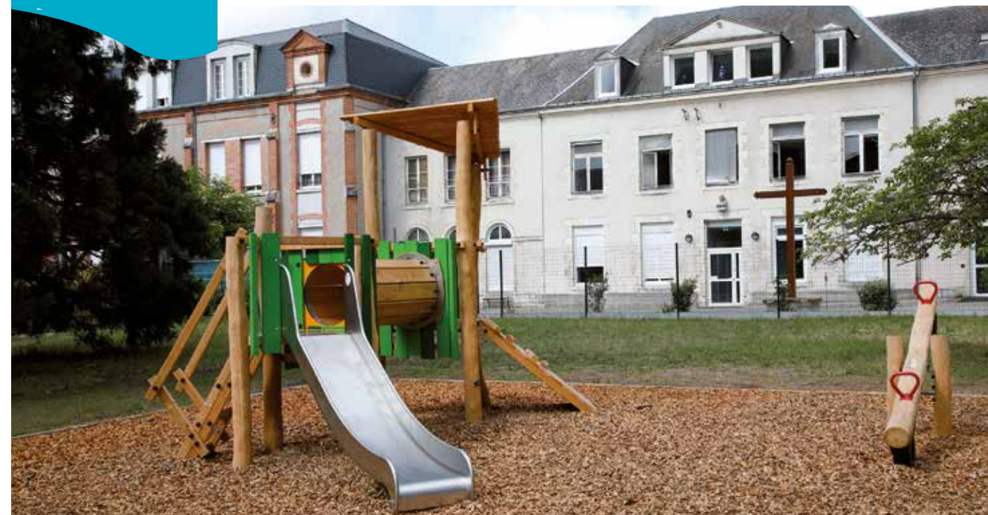
Un nouvel espace de jeux rue Abbé-de-l'Épée.