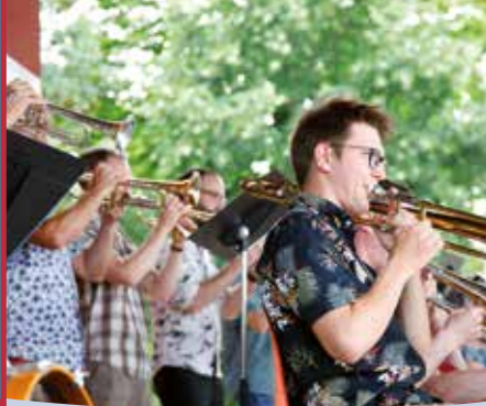
vu à Saint Jean