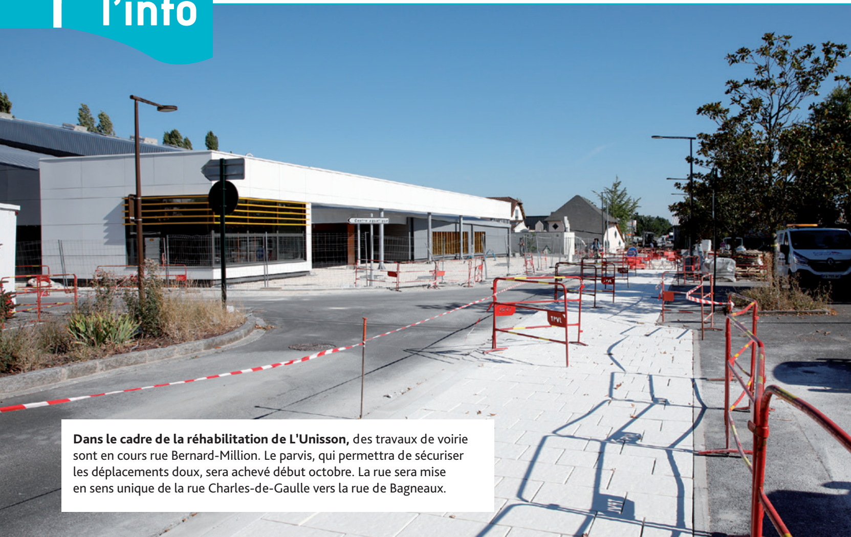
Dans le cadre de la réhabilitation de L'Unisson, des travaux de voirie sont en cours rue Bernard-Million. Le parvis, qui permettra de sécuriser les déplacements doux, sera achevé début octobre. La rue sera mise en sens unique de la rue Charles-de-Gaulle vers la rue de Bagneaux.