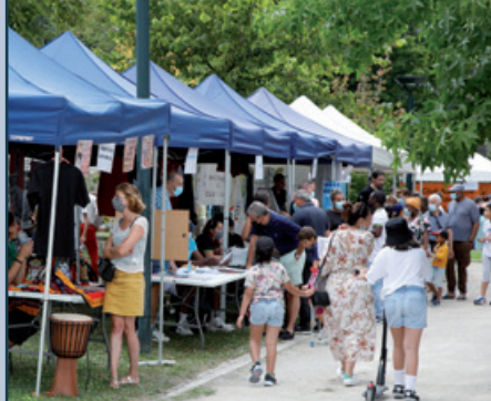
vu à Saint Jean