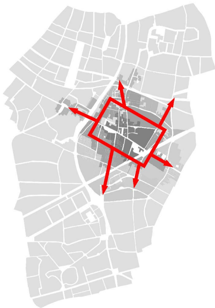
l'affirmation et la consolidation du centre-ville