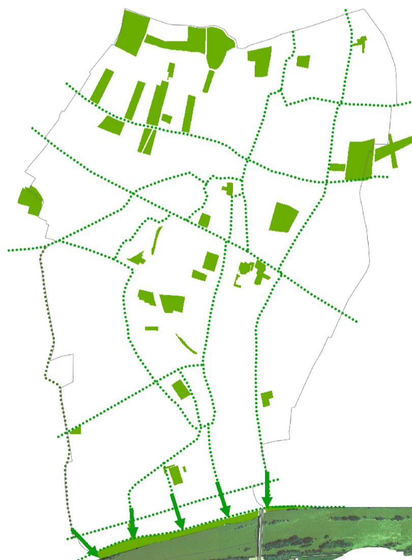
la valorisation des berges de la Loire et leur ouverture vers la ville