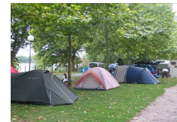
Un site ombragé

- Dep Express 9 allée J. Genet 02.38.73.80.00