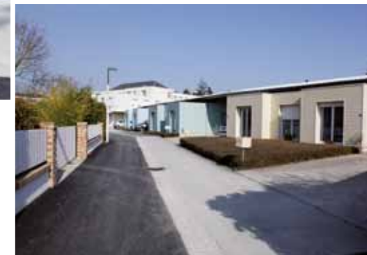
Ci-contre : Réseau enfouis et enrobé neuf au chemin du Fromentin.