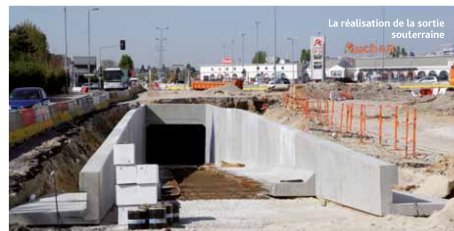
La réalisation de la sortie souterraine

Concernant l'avenue Pierre Mendès-France, la Communauté d'Agglomération Orléans Val de Loire, saisie par la Ville sur la nécessité de refaire cette artère, a convenu de réaliser, à terme, la réfection de la chaussée, la modernisation des installations d'éclairage public, et la création, côté sud de la voie, d'une contre-allée piétons vélos, etc. Ce, dans la section comprise entre la rue de la Cirerie (sortie actuelle d'Auchan) et la rocade ouest. La municipalité demande toujours que toute l'avenue soit rénovée par l'Agglo à l'issue du chantier Auchan.