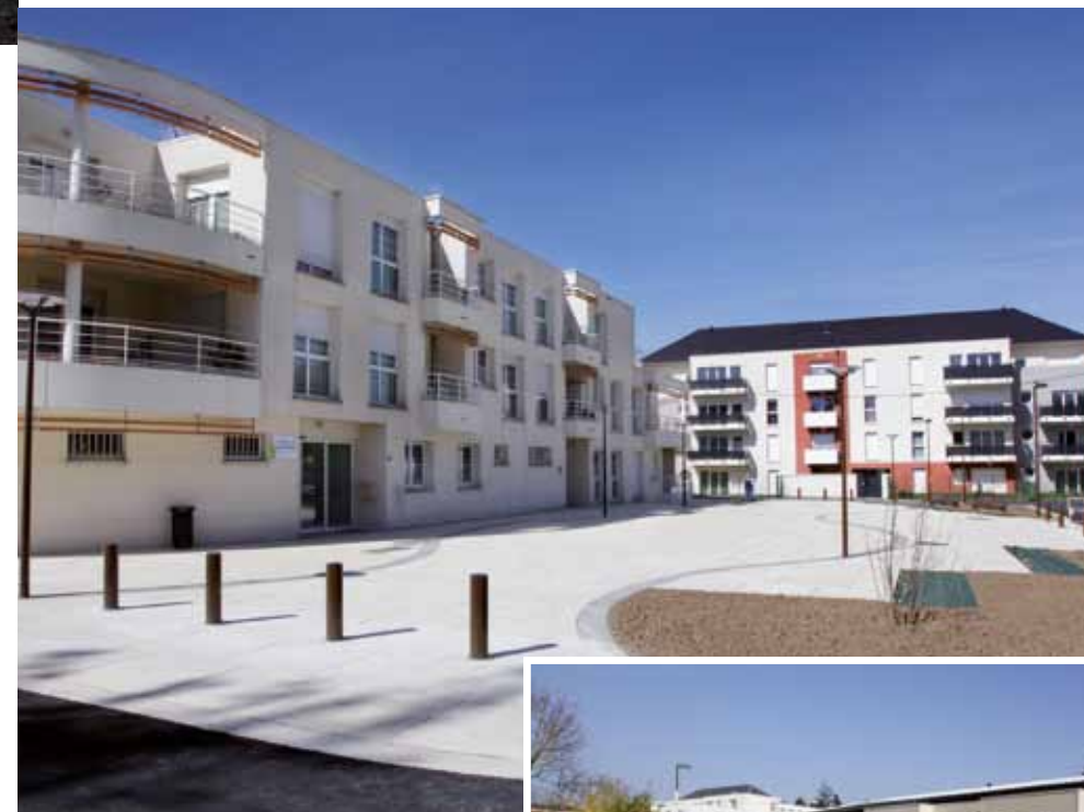
Ci-dessus : La place Edith Piaf présente un nouveau visage.

tallés. Au Mail des Justes de France, accès qui conduit désormais vers l'EHPAD Raymond Poulin, les deux voies - une entrante et une sortante - seront refaçonnées (la portion la plus proche de la rue Charles Beauhaire sera effectuée à l'issue des travaux du programme immobilier Arboria). Les deux voies du mail sont séparées par une partie centrale arborée et des places de stationnement seront matérialisées à proximité de la place Edith Piaf. Enfin un petit espace vert s'appuiera sur celui de l'EHPAD Raymond Poulin. Les travaux devraient durer jusqu'à la mi-mai. Le coût atteindra 500.000 euros TTC.