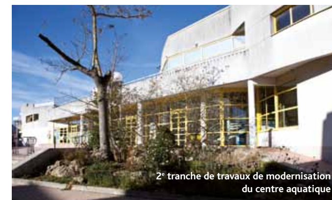
2 e tranche de travaux de modernisation du centre aquatique

Il sera procédé à la réfection des réseaux de production d'eau chaude sanitaire au gymnase des Trois Fontaines et au stade Paul Bert (50.000 €).