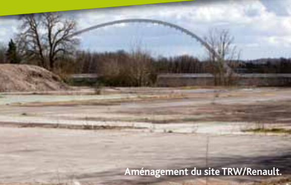
Aménagement du site TRW/Renault.

Le programme d'économies d'énergie sur l'éclairage public sera poursuivi sur 2014.