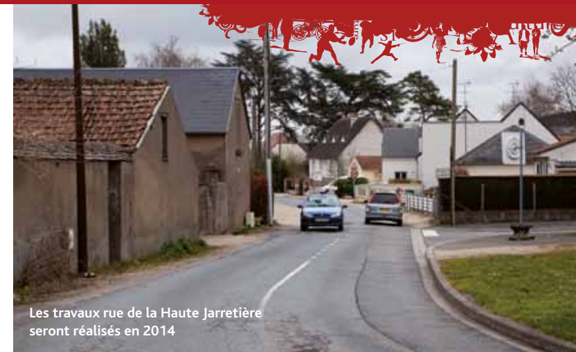
Les travaux rue de la Haute Jarretièrre seront réalisés en 2014

En ce qui concerne les équipements culturels, des travaux relatifs au remplacement du châssis de désenfumage de la scène et des travaux confortatifs des locaux annexes seront réalisés dans la salle polyvalente des locaux de la Maison de la Musique et de la Danse (50.000 €).