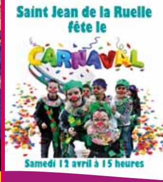
culture - loisirs

le magazine d'information de Saint Jean de la Ruelle