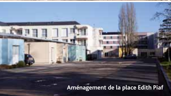
Aménagement de la place Edith Piaf