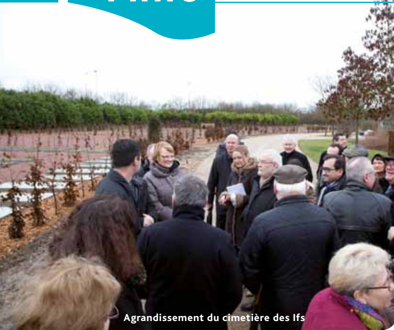
Agrandissement du cimetière des Ifs