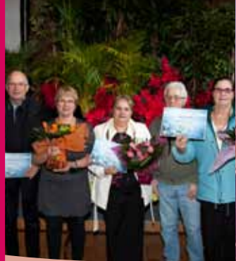
vu à Saint Jean