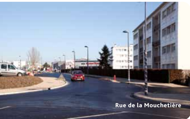
Rue de la Mouchetière