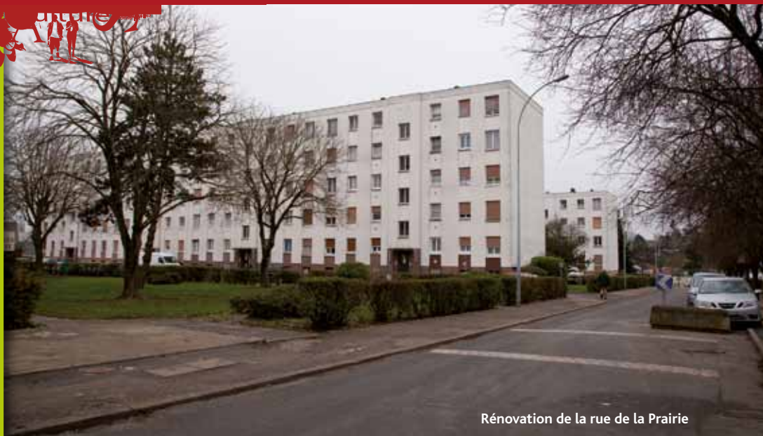
Rénovation de la rue de la Prairie

Le budget primitif pour l'année 2014 sera marqué par l'achèvement de plusieurs opérations initiées précédemment (extension de l'école maternelle Paul Bert, réfection de la rue de la Haute Jarretièrre et de la rue des Chaises), ainsi que la réalisation des engagements liés au Contrat Régional d'Agglomération et la mise en œuvre du plan de sauvegarde de la copropriété de la Prairie. À ce titre, plus de 3 millions d'euros d'investissements sont programmés en 2014 destinés au développement de Saint Jean de la Ruelle, et à l'amélioration du cadre de vie de nos concitoyens et du service public. Dans ce contexte et conformément à ses engagements, la municipalité a voté un budget 2014 permettant de maintenir un service municipal de qualité, de continuer à soutenir l'ensemble des habitants, et notamment les plus fragiles d'entre eux, et d'assurer un niveau d'investissement permettant de répondre aux besoins de la collectivité et de participer activement à l'amélioration du cadre de vie des habitants.